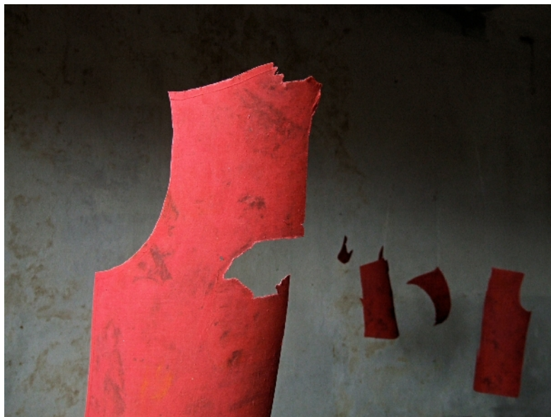
série "mues" tissus sur transparent

mercredi-jeudi-vendredi 14h>18h & samedi 10h>12h-14h>18h