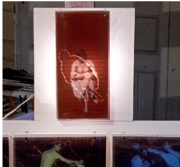
série 'Muybridge, moi et l'ampoule' reproduction sur transparent, polypropylène ajouré, ampoule basse tension

ouvert vendredi, samedi, dimanche de 14h à 19h ou sur rendez-vous vernissage le samedi 1er mai à partir de 17h