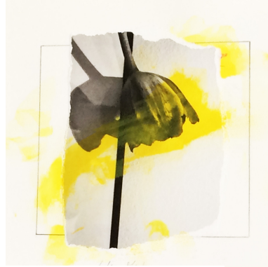
série déchirages "les yeux noirs" 30x30